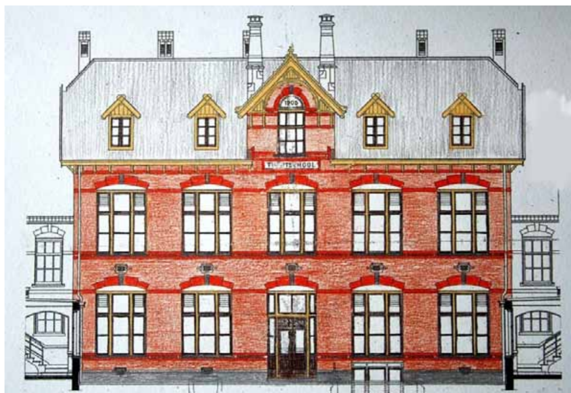
Reconstructie van de oorspronkelijke kleuren op basis van het kleuronderzoek uit 2006. (Tekening afkomstig uit genoemde verslag)

In 2006 is door Josefien & Co een kleuronderzoek naar de geschilderde onderdelen in de voorgevel uitgevoerd. 12 Uit dit onderzoek is gebleken dat de oorspronkelijke kleuren afgestemd waren op de natuurlijke kleur van de gebruikte bouwmaterialen. Dit betekende dat de kozijnen en alle onderdelen van de daklijsten geschilderd waren in een (baksteen) gele kleur. De ramen waren oorspronkelijk geschilderd in een donkerbruine kleur.