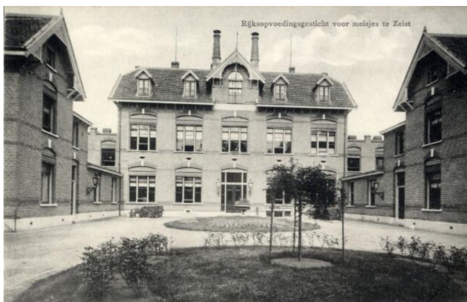
Afb. 4.1 Ansichtkaart "Rijksopvoedingsgesticht voor meisjes te Zeist".

In 2006 is door Josefien & Co een kleuronderzoek naar de geschilderde onderdelen in de voorgevel uitgevoerd. 12 Uit dit onderzoek is gebleken dat de oorspronkelijke kleuren afgestemd waren op de natuurlijke kleur van de gebruikte bouwmaterialen. Dit betekende dat de kozijnen en alle onderdelen van de daklijsten geschilderd waren in een (baksteen) gele kleur. De ramen waren oorspronkelijk geschilderd in een donkerbruine kleur.